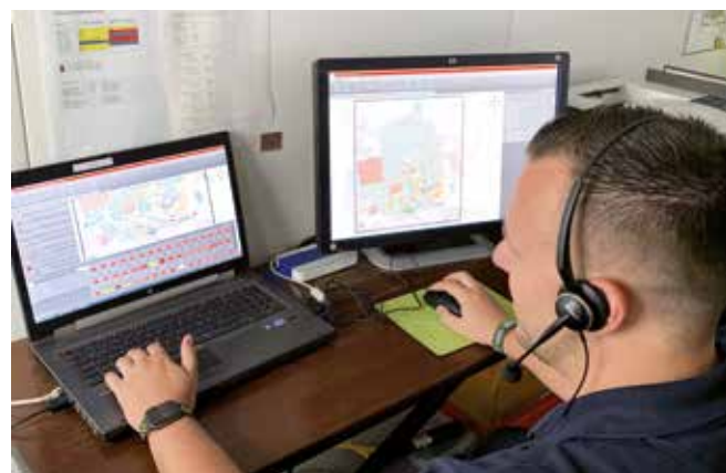
Lagebearbeitung mit metropolyBOS.